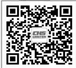
“山西医保”微信公众号