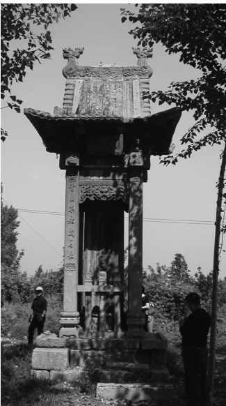
建于清咸丰十一年,为德寿碑楼。

【 英雄楼 】位于磨里镇磨里村。创建于清康熙三十八年(1699),原属一个多进院