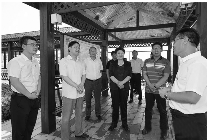
涑水河绛县城区段生态治理工程项目是集防洪、蓄水、生态、人文于一体的城市生态景观水系,也是落实“一泓清水入黄河”的

他鼓励企业在确保安全的前提下,抢抓施工黄金期,力争分秒加快项目建设,争取早日投产达效。要求各地各部门要主动作为、靠前服务,为项目顺利推进提供有力保障。