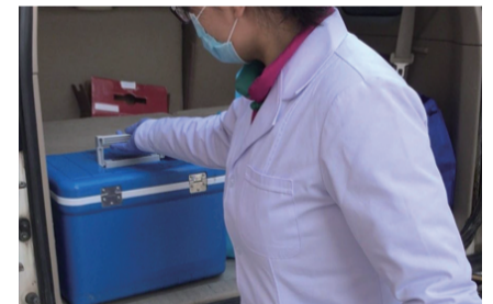
检验科同事到各个隔离点取到核酸样本,并送往市级进行检测