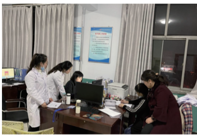
流调组通宵绘制该无症状感染者行动轨迹图