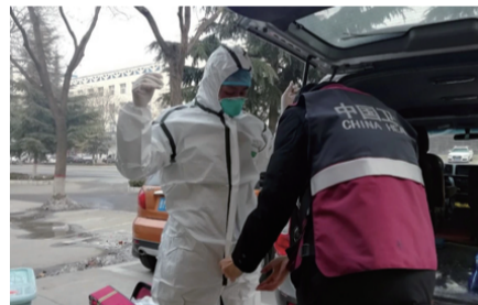
消杀队员分别对 4 个集中隔离点每日两次开展消杀工作