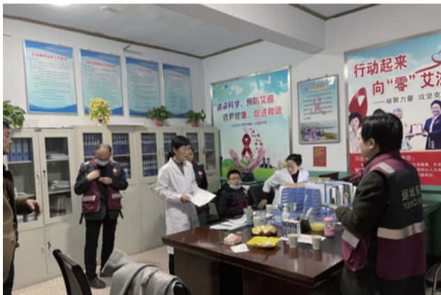
市级专家组指导流调专班通宵开展流调溯源工作