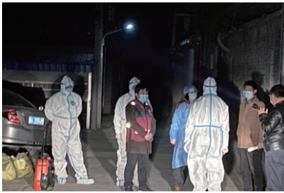
深夜,市级专家组指导对无症状感染者居住环境进行终末消杀