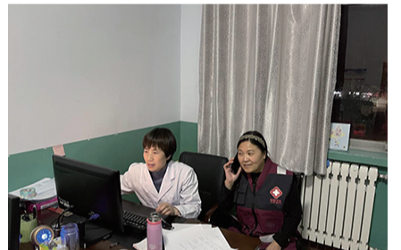
流调专班撰写流调报告