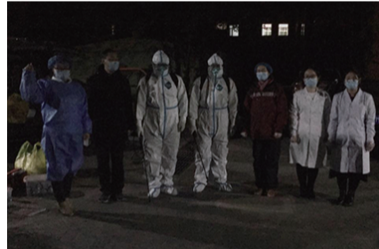
应急小组对密接者居住环境和车辆进行环境采样和消毒