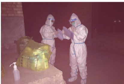
凌晨 2:00 对无症状感染者密接者开展流调