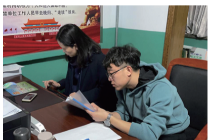
流调人员将次密接者信息汇总推送给各地疾控配合协查、管控