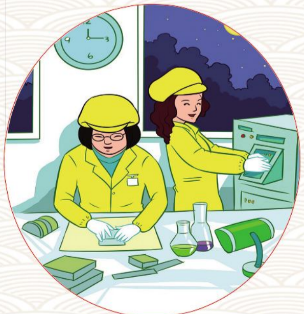
中共绛县县委宣传部 宣