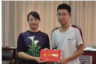
绛县百惠商贸有限公司向受助大学生捐助助学金