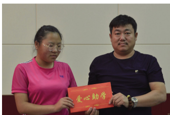
绛县楠桦汽贸向受助大学生捐助助学金