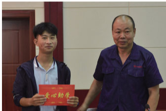
绛县黄鑫铁合金有限公司向受助大学生捐助助学金