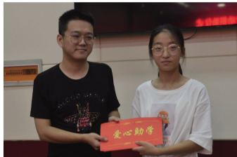
山西山楂树食品有限公司向受助大学生捐助助学金