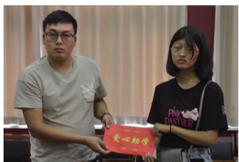
绛县诚信精细化工有限公司向受助大学生捐助助学金