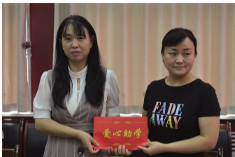
山西欣哲律师事务所向受助大学生捐助助学金