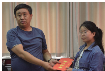
绛县维信铸造材料有限公司向受助大学生捐助助学金