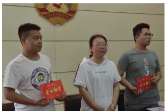
山西江河生物质能发电有限公司向受助大学生捐助助学金