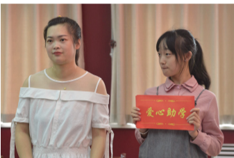
山西骏和高钙灰制品有限公司向受助大学生捐助助学金