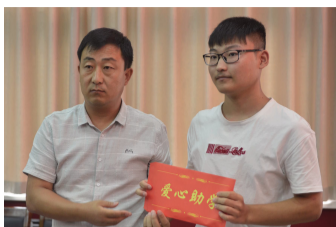
绛县锦运汽修厂向受助大学生捐助助学金