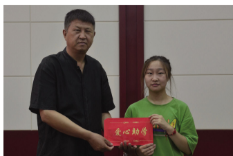
绛县恒达蜂药向受助大学生捐助助学金