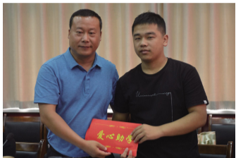
绛县瑞乾车辆检测有限公司向受助大学生捐助助学金