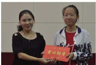
绛县口腔医院向受助大学生捐助助学金