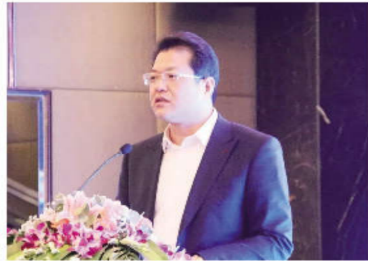
政府副县长毕冠军在会上做项目推介