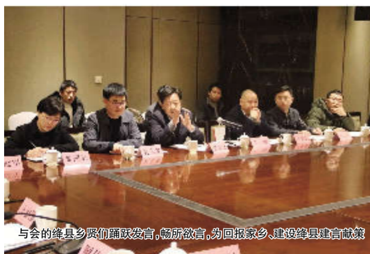
与会的涑县乡贤们踊跃发言，畅所欲言，为回报家乡、建设涑县建言献策