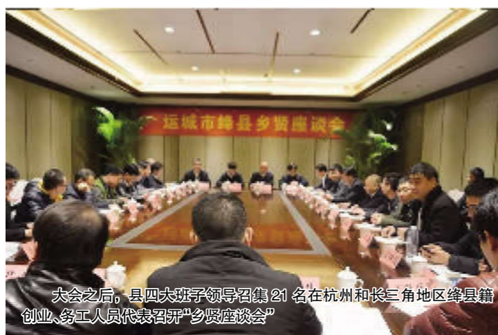
大会之后，县四大班子领导召集 21 名在杭州和长三角地区涑县籍创业、务工人员代表召开“乡贤座谈会”

1月27日，我县在杭州举办“凤还巢”计划暨招商引资推介会，与杭州山西商会、近百位在杭州和长三角地区创业、务工的涑县籍在外人士及部分外地签约赴涑投资合作企业家，欢聚一堂，共念家乡情，同唱“群英会”，齐使一条心，合唱“凤还巢”，用浓浓的乡情，深情呼唤本土人才、科技资金、产业项目和社会公益的回乡回流。 会上，运城市涑县关心关爱在外人员服务中心为杭州联络服务站授牌，涑县人民政府与浙江方成机电有限公司、江南纺织有限公司、中科院苏州地理信息与文化科技产业基地等8家企业签订了投资合作协议，投资总额21.8亿元。 近年来，涑县县委、县政府确立了“两乡五区”发展思路，即建设全国樱桃之乡、绛老长寿之乡、省域特色农产品加工区、文化旅游融合区、新型能源集聚区、机械制造转型区和通航产业示范区。 围绕这一思路，全县上下开拓创新，真抓实干，推动经济社会持续快速发展，各项事业不断推进。尤其在实施“凤还巢”计划和招商引资工作上，我县更是将其作为促进经济发展、增加农民收入的重要举措来抓，突出以“乡”招商，以“情”引资。目前，全县在外务工人员1.5万人，涉及食品、餐饮、家政等行业。涑县“凤还巢”计划借助这些在外务工人员的优势和力量，通过关心关爱活动，用3—5年时间，扎实开展1万人转移就业，3000人培训提升技能，100人返乡创业，20人返乡兴业，打造1—2个涑县特色的劳务品牌，将“凤还巢”计划打造成拓宽百姓增收的“就业计划”，支持群众“闯世界”、“闯市场”的“开放计划”，在县内外形成“关心涑县发展、参与涑县发展、助力涑县发展”的良好氛围。同时，我县积极对标发达地区先进做法，对接沿海地区投资贸易通行规则，正在全力打造审批最少、流程最优、体制最顺、机制最活、效率最高、服务最优的营商环境，高标准规划建设了“双创”孵化园区，已吸引浙江义乌日用品有限公司等4家企业落户，并与7家企业达成入驻意向；更有“风铃车辆”、“永立铸造”、“骏和高钙”、“众莱日用品”等涑县籍在外成功人士，返乡投资创业，当年建成投产。县委书记王宏伟表示，涑县将进一步加大对签约项目的支持力度，对投资者高看一眼、厚爱三分，共建共享，同舟共济，血脉相连，患难与共，打造一流的政务环境、一流的法治环境、一流的社会环境和一流的营商环境，全力确保项目顺利开工、投产达效。 涑县与会人员还考察参观了浙江浩帆贸易有限公司、日昌升集团和现代农业综合体，并就涑县通用航空项目与广东龙浩航空集团有限公司进行了有效对接。 张广瑞