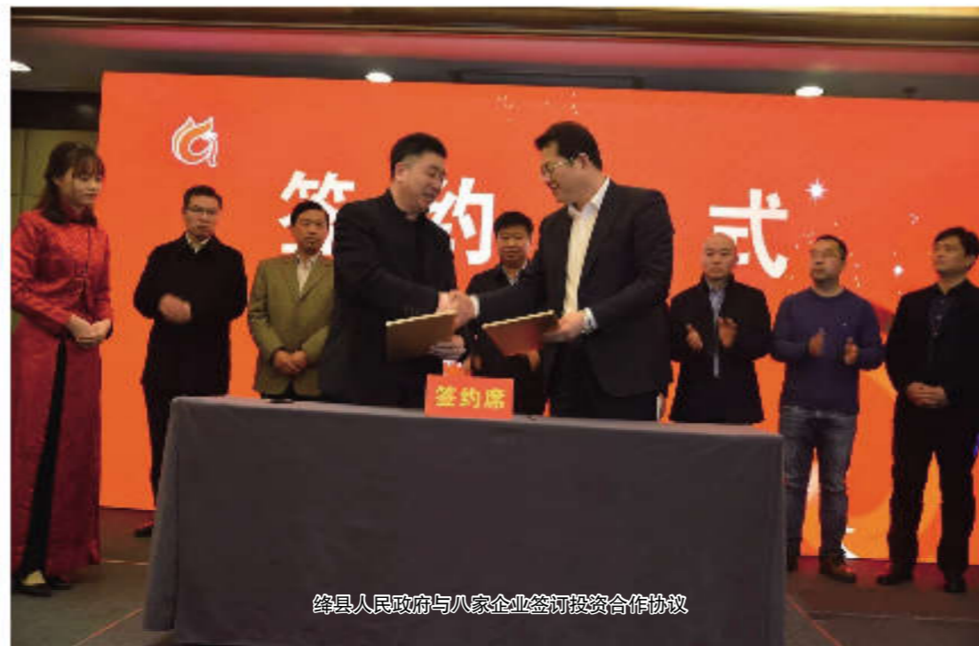
涑县人民政府与八家企业签订投资合作协议