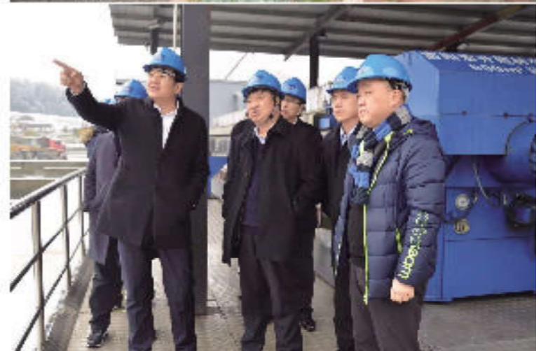
县领导和有关部门负责人到企业考察参观