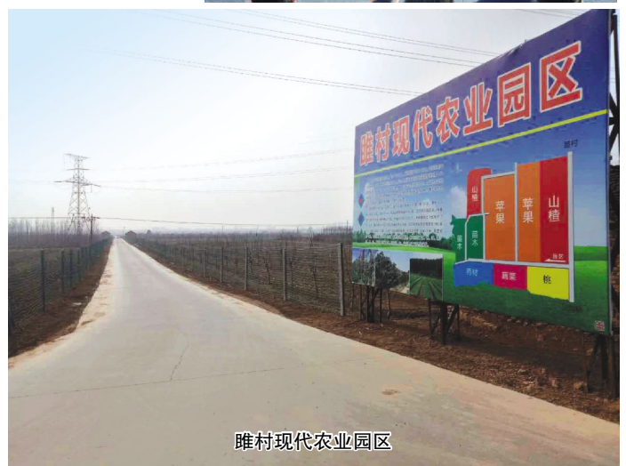
睢村现代农业园区