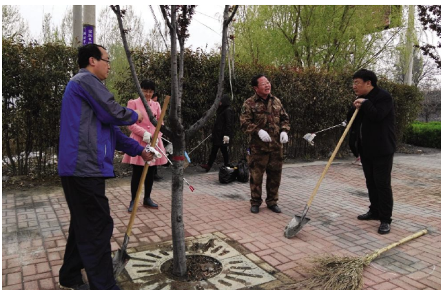
机关干部开展环境卫生整治活动

卫庄镇位于县城东部,东华山脚下,镇域内平均海拔788米左右。全镇国土总面积20万亩,其中耕地面积1.1万亩,林地面积15.79万亩。境内有省级森林公园东华山森林公园、国家级文物保护单位太阴寺、省级文物保护单位晋文公墓等旅游资源。横水至翼城一级公路穿境而过,交通便利、气候宜人,风景秀丽、人杰地灵。