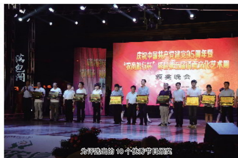
为评选出的10个优秀节目颁奖