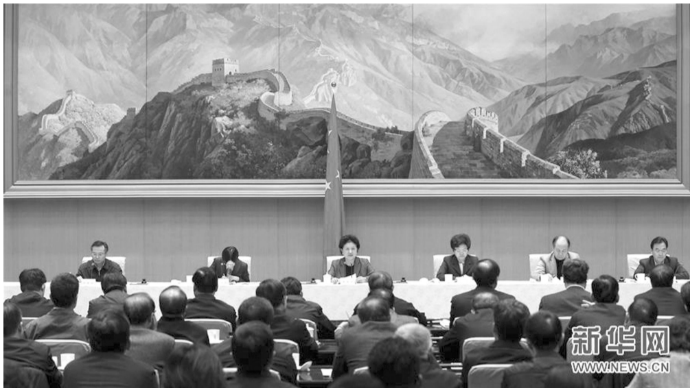
1月7日,全国计划生育工作电视电话会议在北京召开。中共中央政治局委员、国务院副总理刘延东出席会议并讲话。