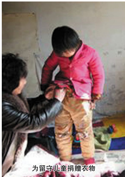
为留守儿童捐赠衣物