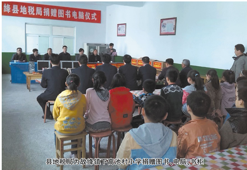
县地税局为古绛镇下高池村小学捐赠图书、电脑、书柜