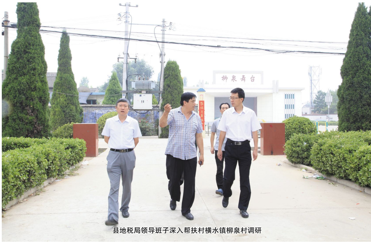
县地税局领导班子深入帮扶村横水镇柳泉村调研

加强纳税服务是文明单位创建的一项重要体现。县地税局始终注重服务与管理并举,执法与服务同行,注重服务与民生结合,追求尽善至美的服务境界,不断延伸纳税服务广度和深度。在落实“两项减负”、完善“一窗式”服务的基础上,在服务流程上,通过整合办税厅窗口职能,精简办税流程4项,取消重复或不需报送的资料5项18种;将直属一分局和二分局合并办公,减少了纳税人为办理房地产涉税事项来回奔波之苦。先后推出“导税员”、“免填单”、POS机刷卡缴税、“AB角零缺位制”、“一机双屏”、“涉税服务卡”等便民利民服务新举措。成立“税企之家”、打造“微服务”培训平台,为纳税人提供权威、便捷的纳税辅导与咨询服务。开展“局长办税周”、“局长征求意见周”及“纳税服务质效回访”等一系列活动,建立重点税源企业定点联系服务制度,进一步拓展服务内涵,延伸服务链条;建立健全了地方税收保障体系,顺利实现了全县38个部门从“协税护税”到“综合治税”的转变;成立了“志愿者服务队”,全力打通服务纳税人、服务社会“最后一公里”。特别是今年7月份,县地税局与国税部门成功实现了联合办公,真正实现“进一家门,办两家事”的服务效应,全县超过2000户的纳税人将从国地税联合办公中直接受益,具有