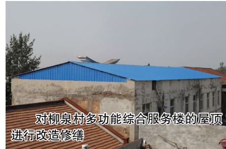
对柳泉村多功能综合服务楼的屋顶进行改造修缮