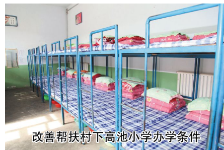
改善帮扶村下高池小学办学条件