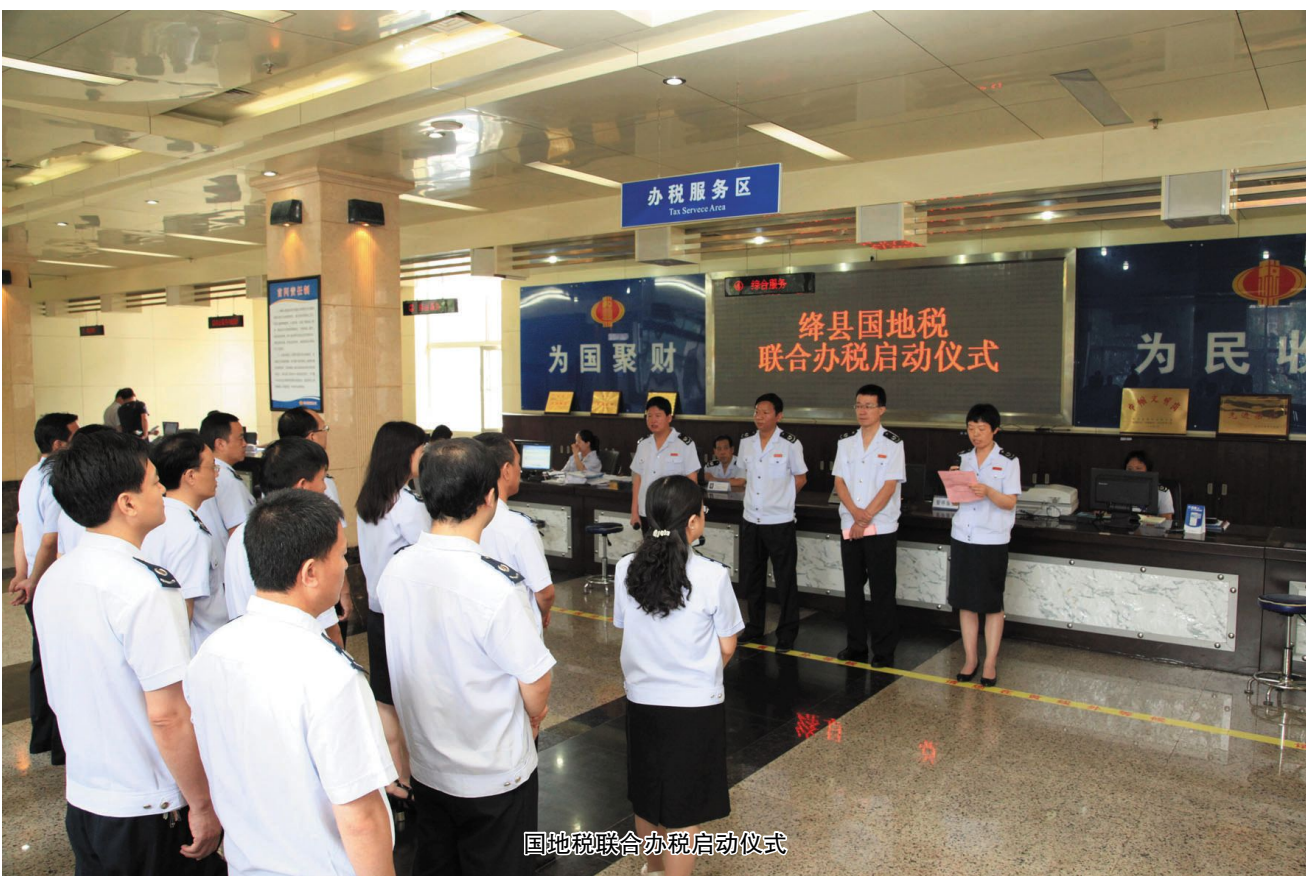
国地税联合办税启动仪式