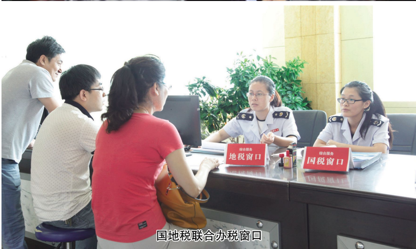
国地税联合办税窗口