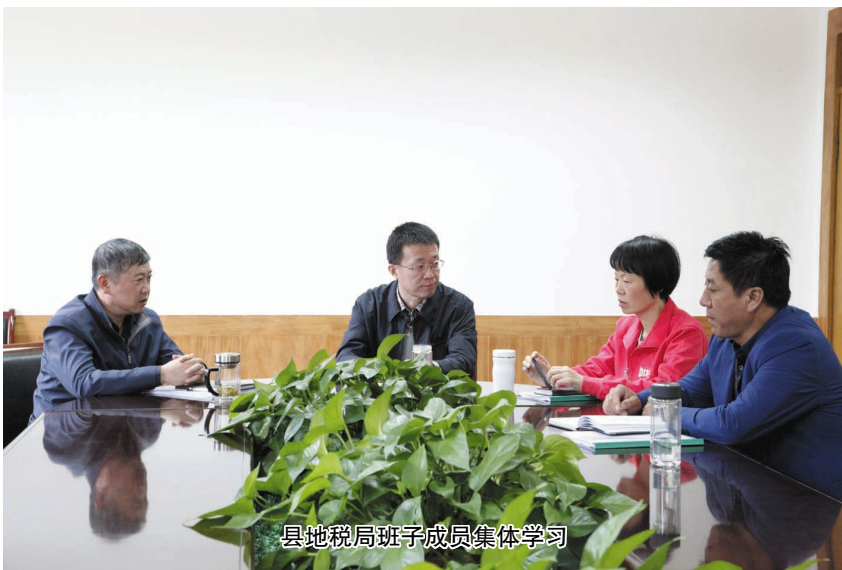
县地税局班子成员集体学习