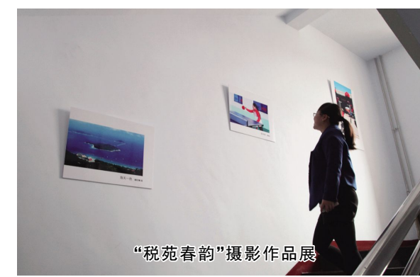
“税苑春韵”摄影作品展