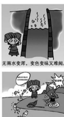
无雨水浑，天色变味又难闻。