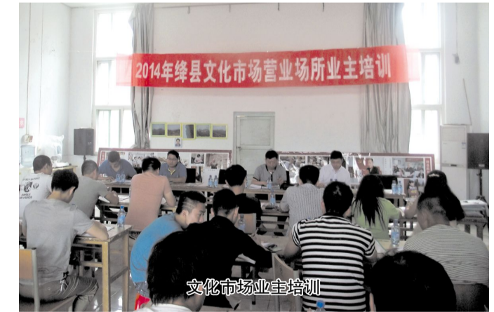
文化市场业主培训