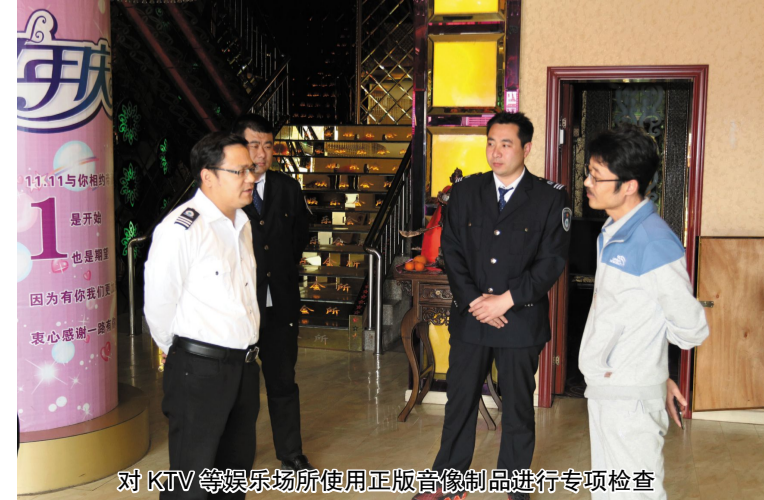
对KTV等娱乐场所使用正版音像制品进行专项检查