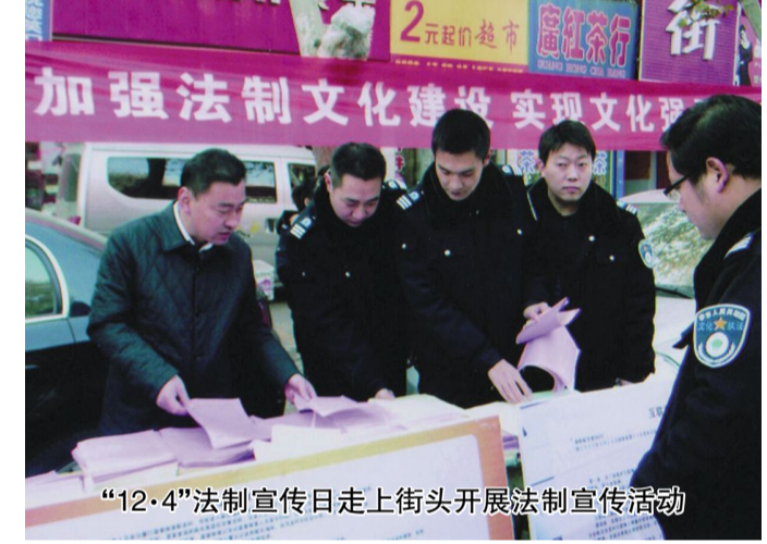
“12·4”法制宣传日走上街头开展法制宣传活动