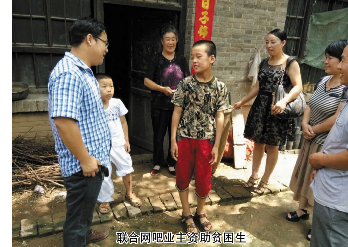
联合网吧业主资助贫困生