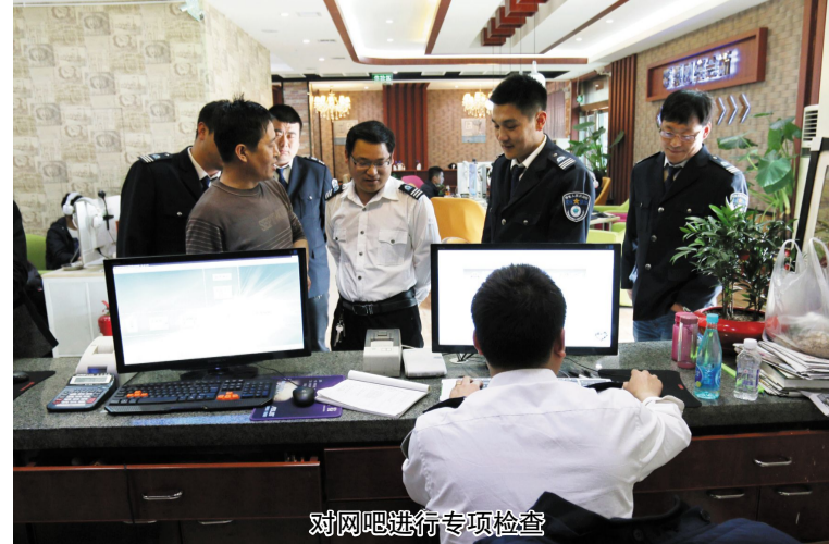
对网吧进行专项检查