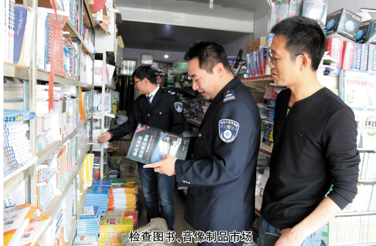
检查图书、音像制品市场