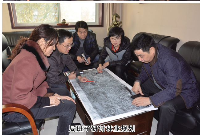
局班子研讨林业规划