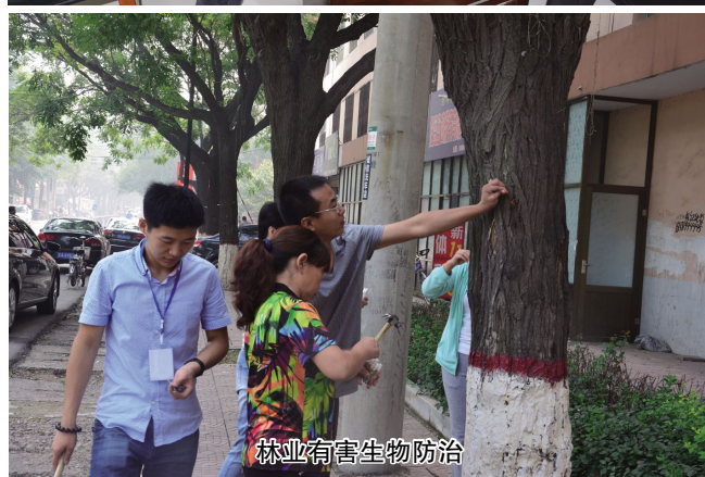
林业有害生物防治