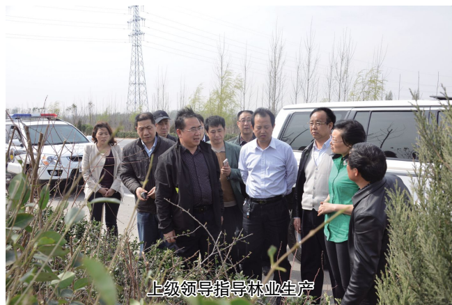
上级领导指导林业生产