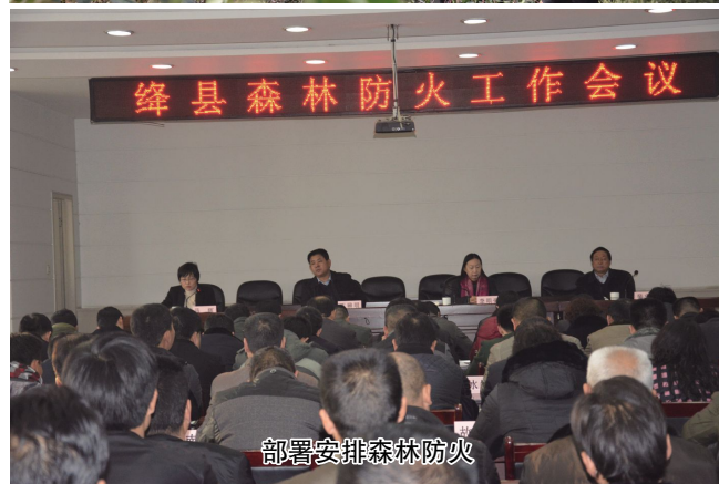
部署安排森林防火