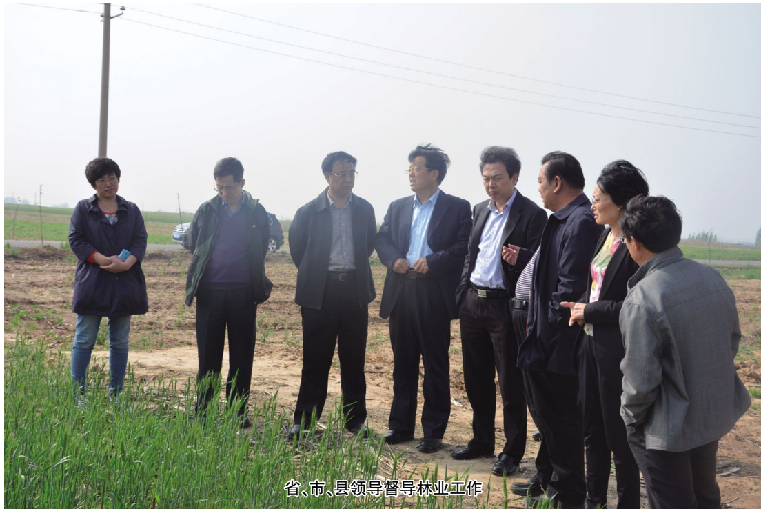
省、市、县领导督导林业工作

2014年,在县委、县政府的正确领导和上级林业部门的关心指导下,县林业局认真贯彻党的十八届三中、四中全会精神,以党的群众路线教育实践活动为引领,紧紧围绕“山上治本、身边增绿、产业富民、林业增效”的工作思路,按照规模化布局,科学化实施的建设目标,大力开展造林绿化,着力抓好森林资源保护,突出干果经济林这个重点,全县林业各项工作取得了显著成绩。2014年1月,该局被运城市精神文明指导委员会授予“运城市2012年—2013年度文明单位”;2014年8月,我县被省政府授予“全省林业生态县”。同时,该局还被确定为运城市市级依法治理窗口示范单位。